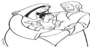
PÉROLAS DO PAPA FRANCISCO: